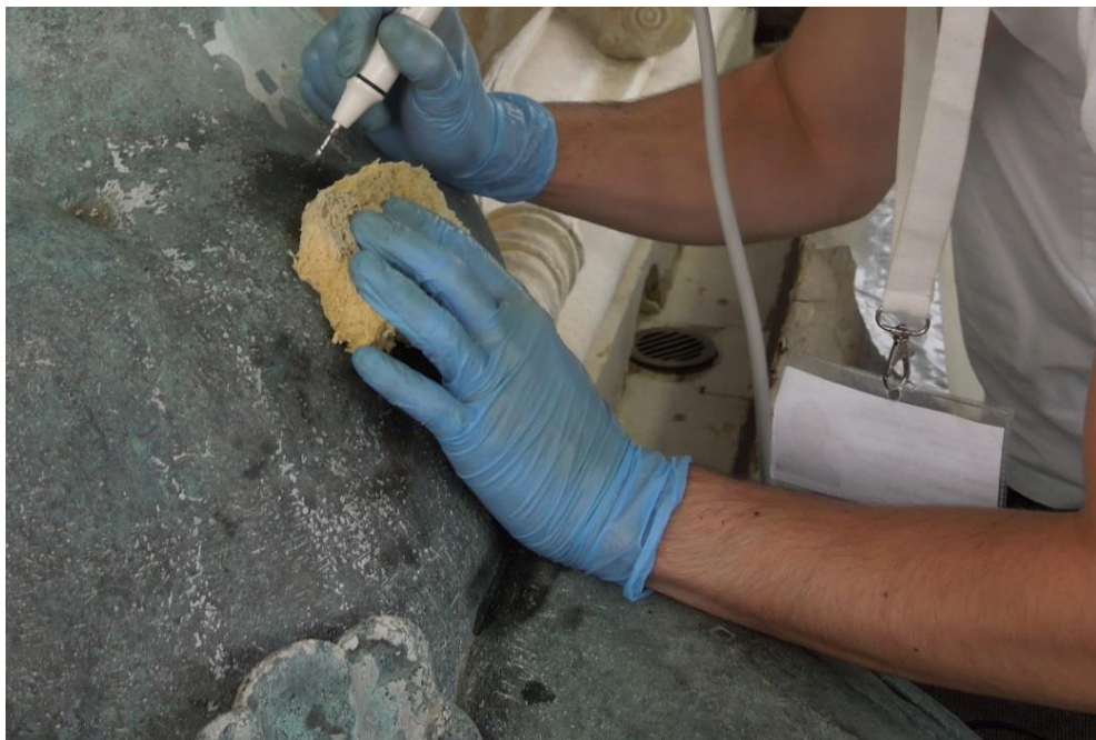
Restauro Fontana del Nettuno - Bologna